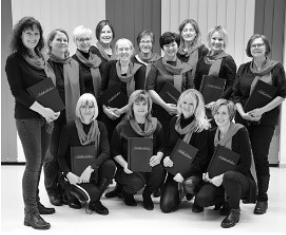
Die Sektkehlchen laden ein

... zu einem launigen Nachmittag bei Kaffee und Kuchen mit heiteren Frühlingsweisen am