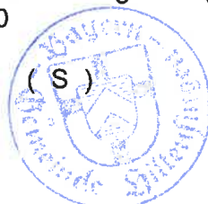
Jrmler 1. Bürgermeister

angeheftet: 05.06.20 abgenommen: Handzeichen: